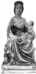
Epifania do Senhor Ano C